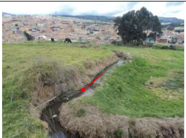
Foto No. 12. Conducción de la derivación de la quebrada Yomasa al interior del predio Cantarrana. (Punto 1 - Imagen 3).