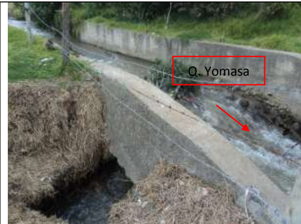
Foto No. 11. Ruptura de la pared lateral para la derivación del caudal de la Quebrada Yomasa por el predio Cantarrana. (Punto 7 - Imagen 3).