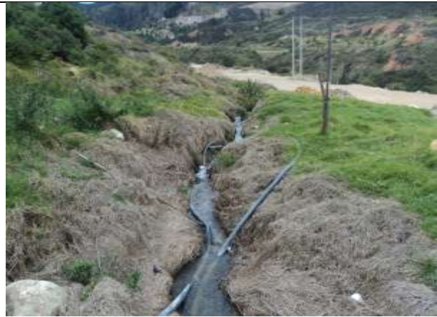
Foto No. 3. Punto de captación. Mangueras sumergidas.