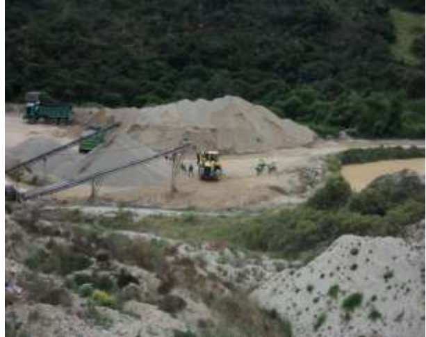
Foto No. 1. Área donde se localiza la planta de beneficio de Agregados Cantarrana.