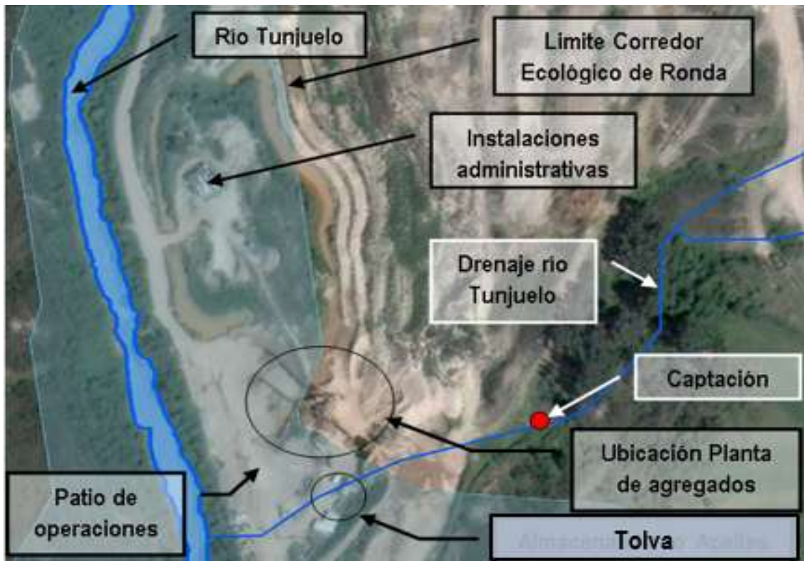
Imagen 2. Ubicación de la planta de beneficio de Agregados Cantarrana, sus instalaciones, lugar de captación de agua superficial y ZMPA